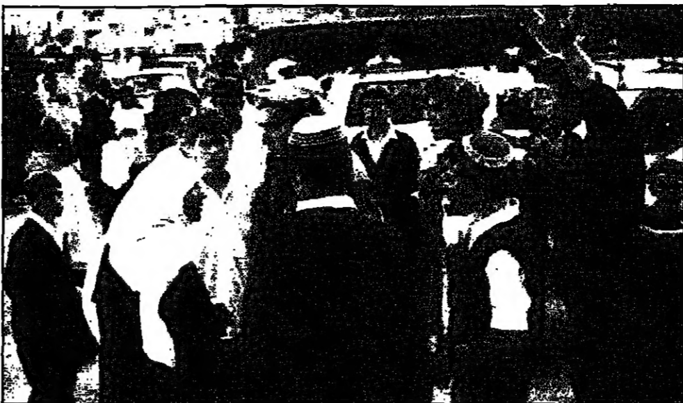
مستوطنون يمتنعون أمام قوات فلسطينية من التوصل لاتفاق بعد مواجهات في مدينة الخليل